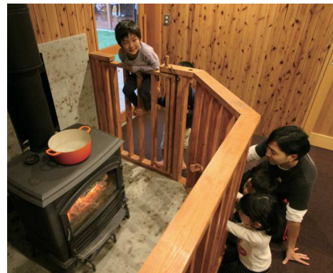
まつぼっくり保育園