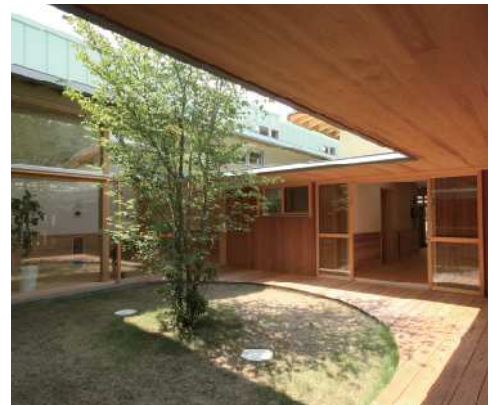
青葉ひよこ保育園