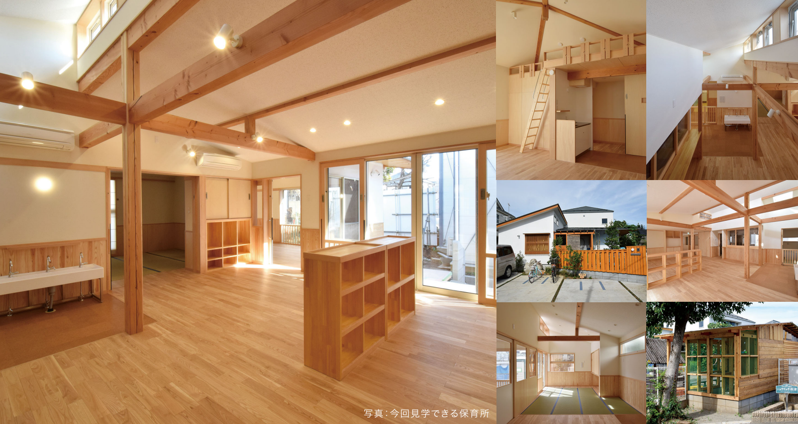
写真:今回見学できる保育所