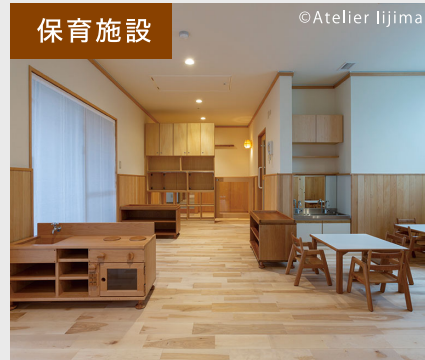
RISSHO KID'Sきりり代沢(世田谷区)