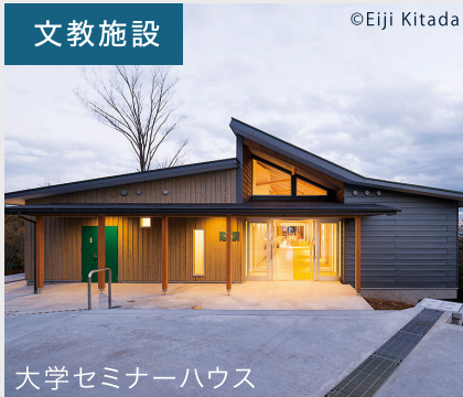
大学セミナーハウス