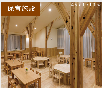
まつぼっくり保育園(羽村市)