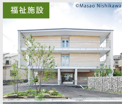
ベストライフ杉並(杉並区)